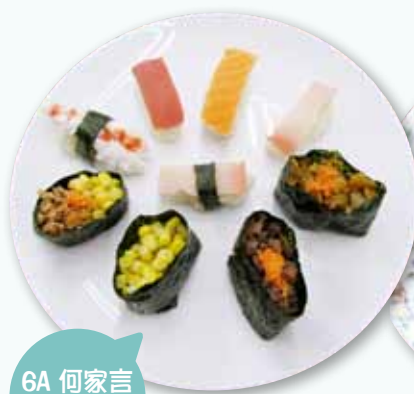
6A 何家言 日式素壽司