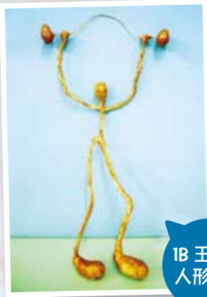
1B 王曉嵐 人形雕塑