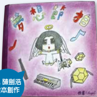
4A 陳劍浩 繪本創作