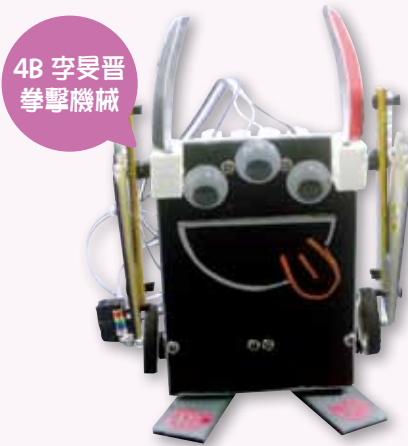
4B 李旻晉 拳擊機械