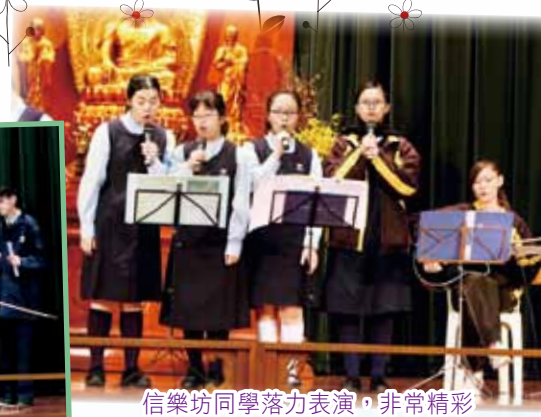
信樂坊同學落力表演，非常精彩