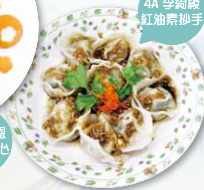
4A 李綺綾 紅油素抄手