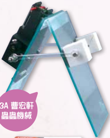
3A 曹宏軒 蟲蟲機械