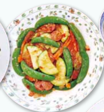
5B 江承瓏 三蔬炒素臘腸 + 香菇銀絲羹