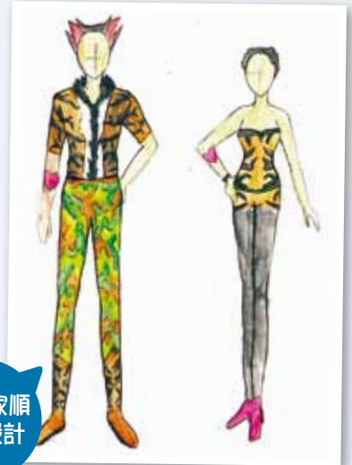
2B 梁家順 時裝設計