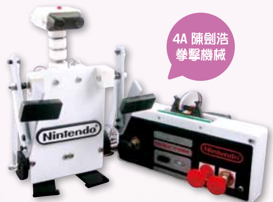
4A 陳劍浩 拳擊機械