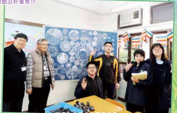
同學為來賓介紹佛教文化