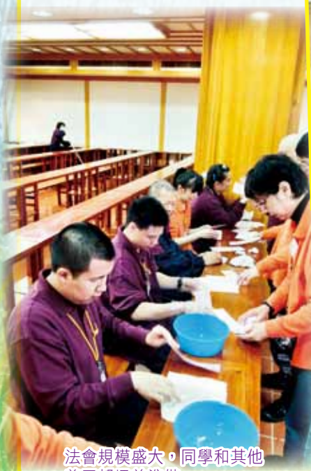
法會規模盛大，同學和其他義工都埋首準備