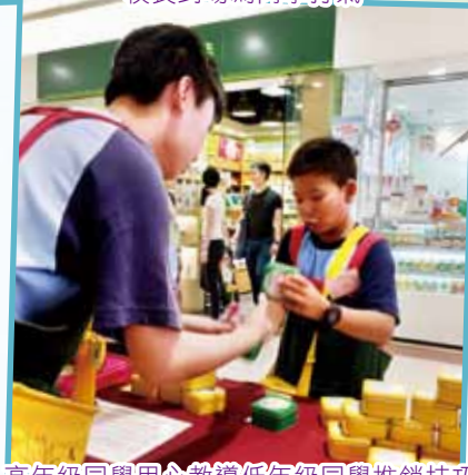
高年級同學用心教導低年級同學推銷技巧