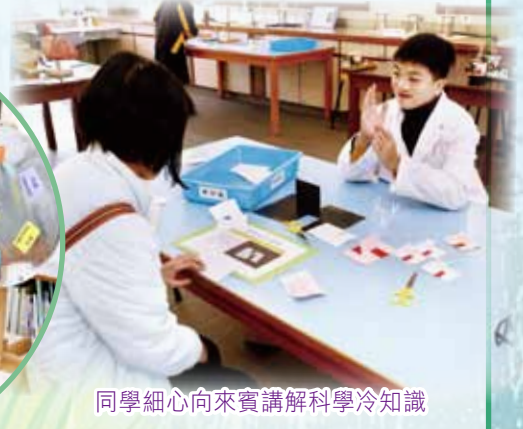
同學細心向來賓講解科學冷知識