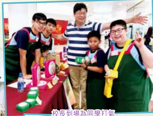
校長到場為同學打氣