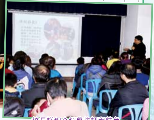
校長詳細介紹學校課程特色