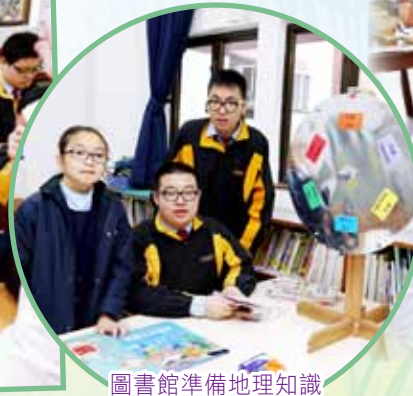
圖書館準備地理知識的遊戲及好書推介