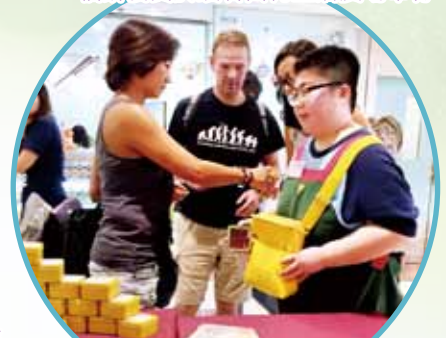
同學主動向外籍遊客推銷福餅