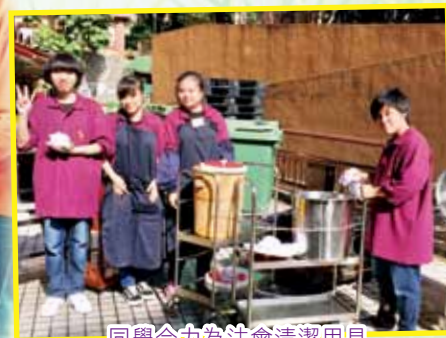
同學合力為法會清潔用具