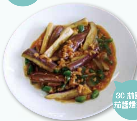
3C 林鍵樂 茄醬燴茄子