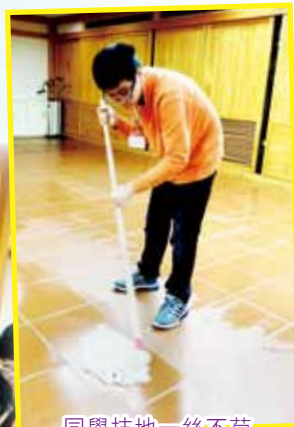
同學抹地一絲不苟