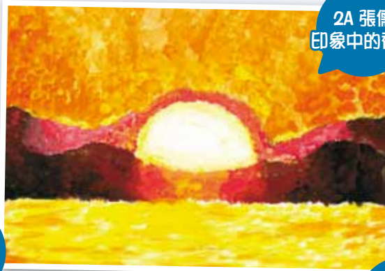
2A 張儒 印象中的香港