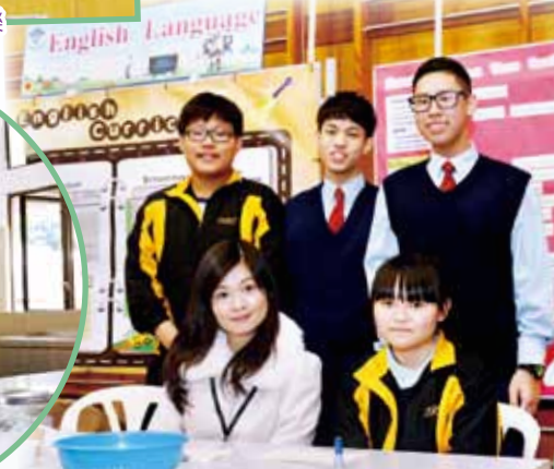
同學準備有趣的英語遊戲供來賓參與