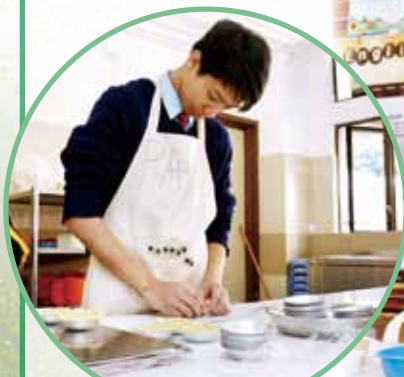
同學正在製作開放日小食