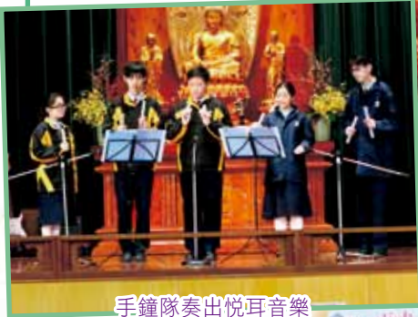
手鐘隊奏出悅耳音樂