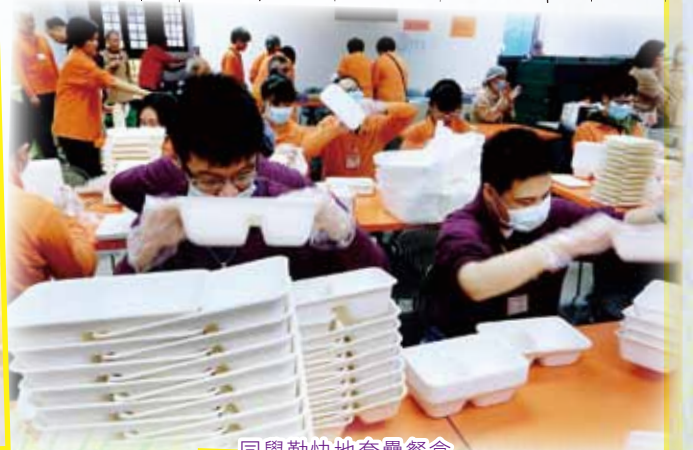
同學勤快地套疊餐盒