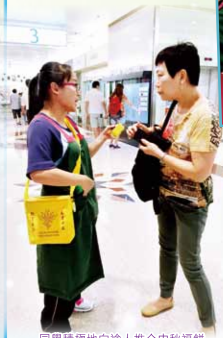
同學積極地向途人推介中秋福餅