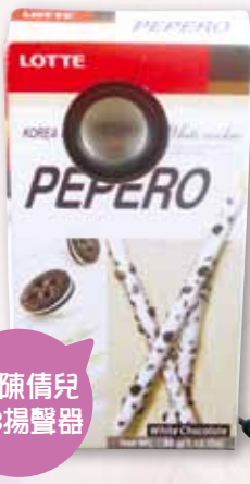
5B 陳倩兒 USB揚聲器