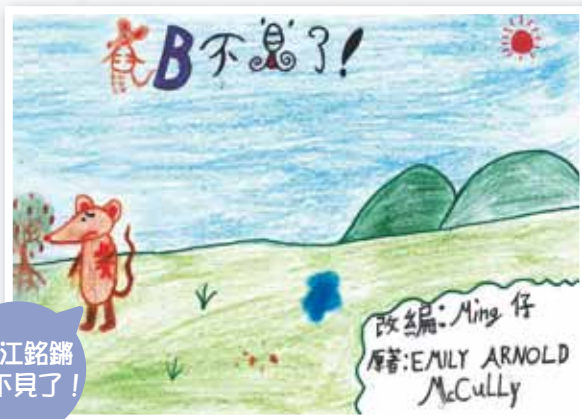
2A 江銘鏞 鼠B不見了!