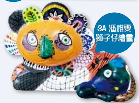
3A 潘雅雯 獅子仔繪畫