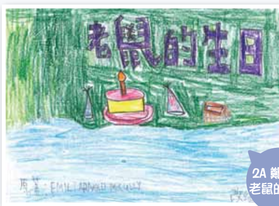
2A 鄭泉豐 老鼠的生日