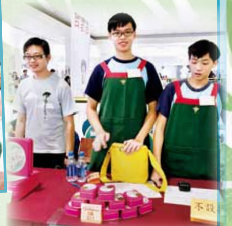
福餅義賣於鑽石山荷里活廣場舉行