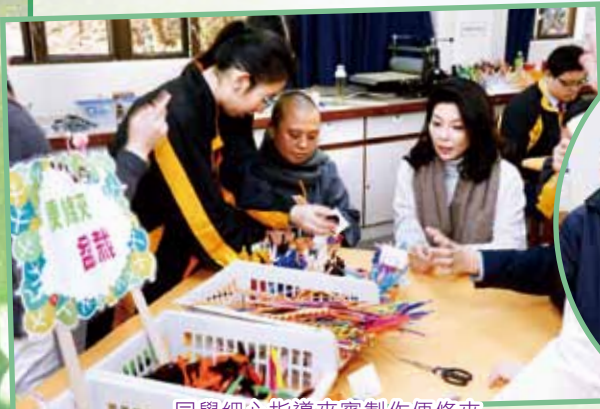
同學細心指導來賓製作便條夾