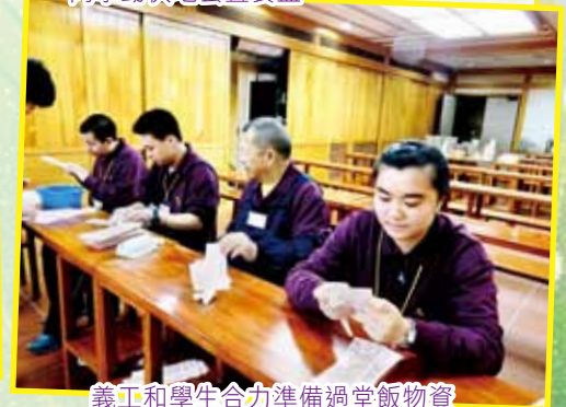
義工和學生合力準備過堂飯物資