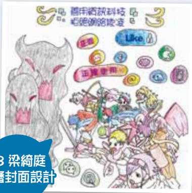
3B 梁綺庭 月曆封面設計