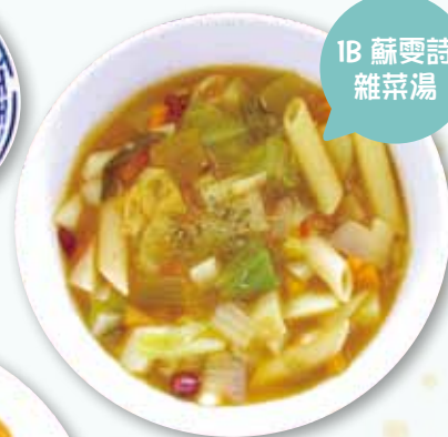
1B 蘇雯詩 雜菜湯