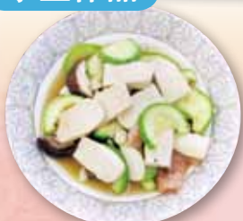
青瓜炒五香豆腐乾