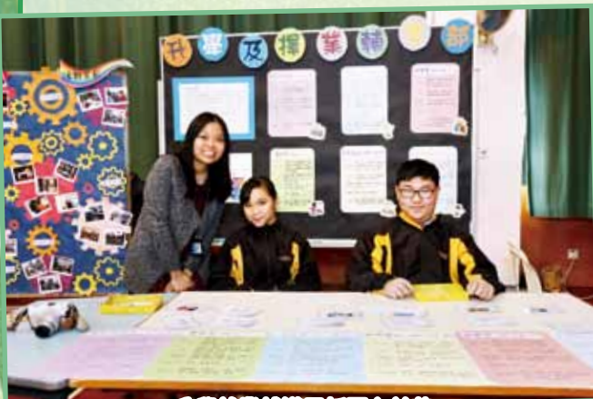
升學就業輔導展版圖文並茂