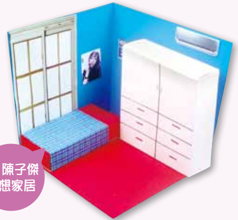
6C 陳子傑 理想家居