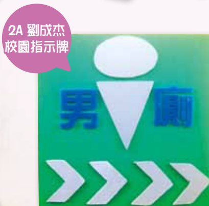
2A 劉成杰 校園指示牌