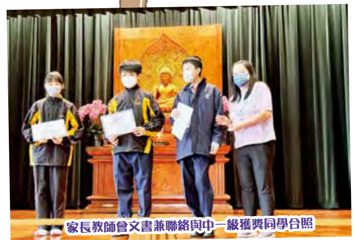
家長教師會文書兼聯絡與中一級獲獎同學合照