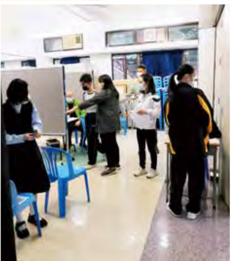
流感針注射活動當天，家長義工協助指導本校學生。