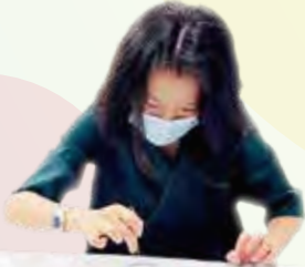
家長專心地製作乾花蠟燭杯。

本年度第一次家長組聚已於 11 月 28 日舉行。當天的活動名為「香氛藝術手工坊——乾花蠟燭杯」。當天活動氣氛良好，在導師的細心講解及指導下，家長均能透過運用乾花、透明蠟燭液及玻璃杯等材料，製作出形形色色、美侖美奐的乾花蠟燭杯。活動結束後，大家都舉起了精美的製成品合照留念，面露歡顏。