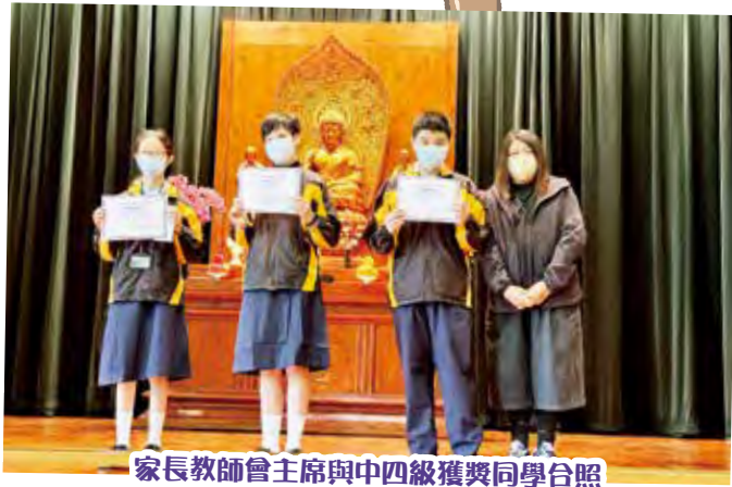
家長教師會主席與中四級獲獎同學合照