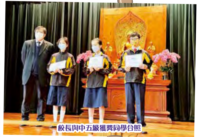
校長與中五級獲獎同學合照