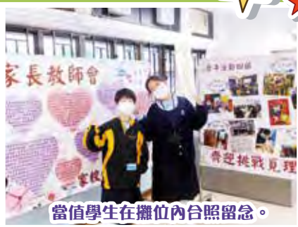
當值學生在攤位內合照留念。

本校於 2022 年 12 月 16 及 17 日連續兩天舉辦了 25 周年校慶開放日。當天本會在 2 樓 208D 室內開設攤位，設有本會的歷年活動回顧及家長心聲展板，同時亦擺設了幾個手作攤位；讓參觀者既可安靜地閱覽展版內容，又可進行動態活動。當天來訪本會攤位的人流理想，當中不少人參與手作活動；前校長伍日明先生也特意撥冗到訪，令整個攤位生色不少。