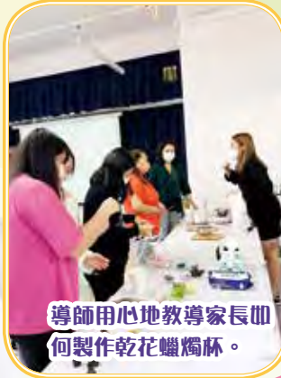
導師用心地教導家長如何製作乾花蠟燭杯。