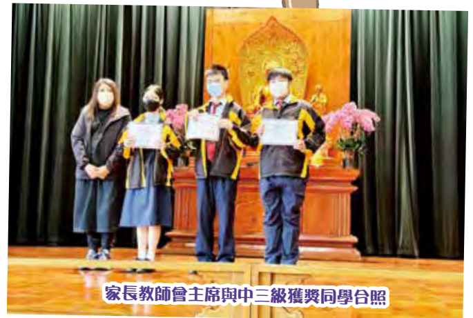
家長教師會主席與中三級獲獎同學合照