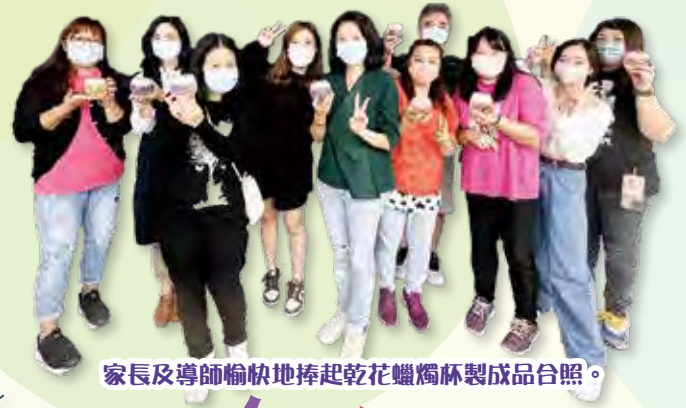
家長及導師愉快地捧起乾花蠟燭杯製成品合照。