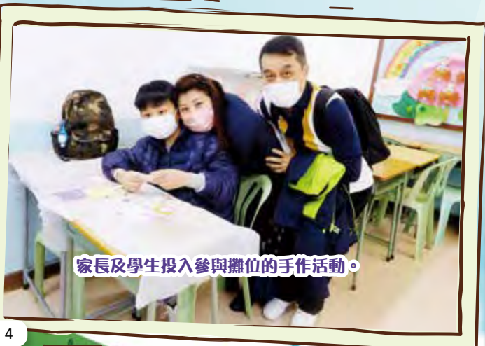
家長及學生投入參與攤位的手作活動。