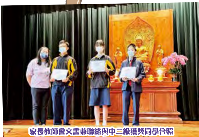
家長教師會文書兼聯絡與中三級獲獎同學合照