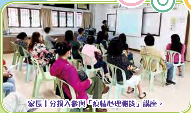
家長十分投入參與「疫情心理秘笈」講座。