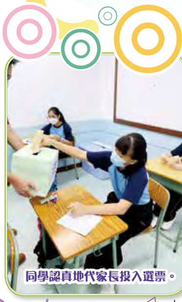
同學認真地代家長投入選票。