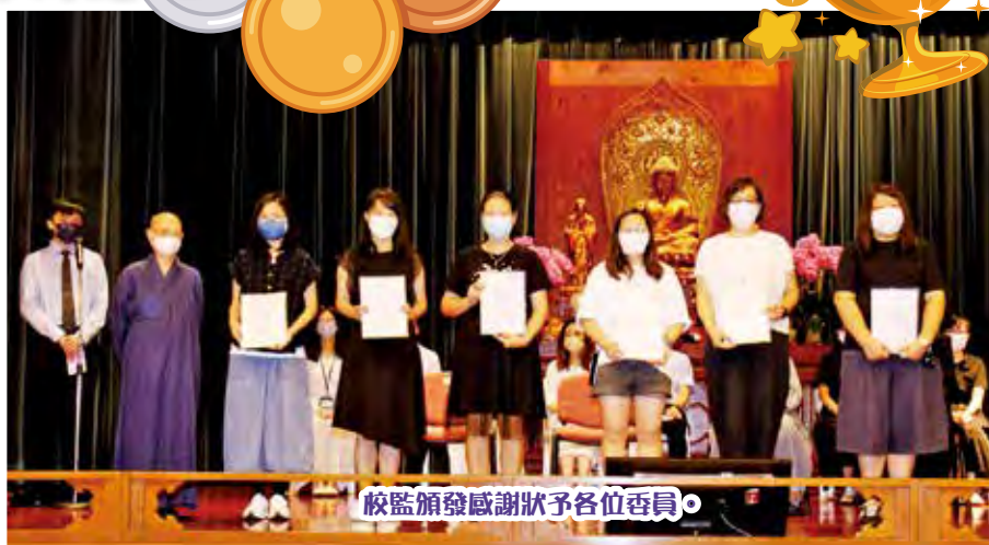
校監頒發感謝狀予各位委員。

校監於 9 月 1 日開學典禮頒發感謝狀予第二十屆家長教師會常務委員，感謝各位委員過去一年的貢獻。