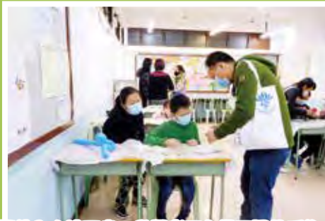
攤位內人流不少，參觀者正在做不同的手作。