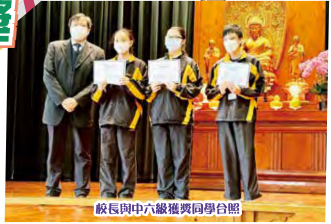
校長與中六級獲獎同學合照