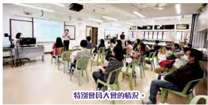
特別會員大會的情況。