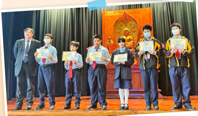
中三級獲獎同學合照