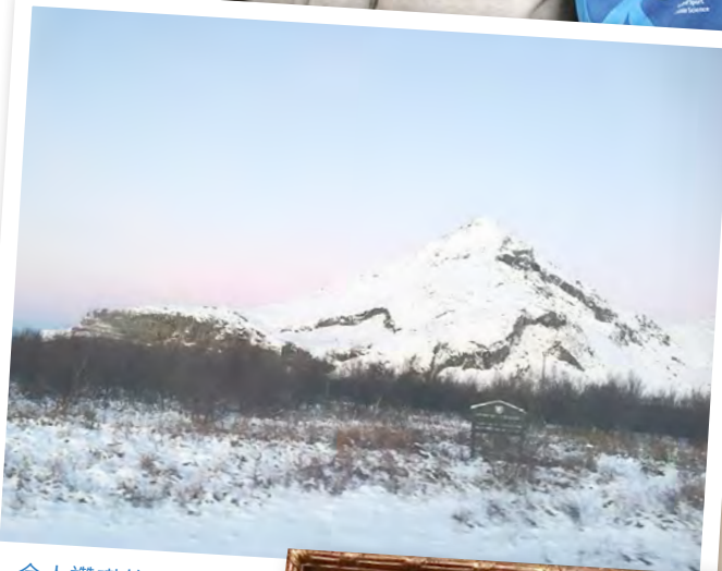
令人讚嘆的自然雪景

除此之外，我還趁著這難得的機會遊覽了歐洲各國，深入了解各地的文化。這擴大了我的視野，例如參觀冰洞、歷史建築和博物館，欣賞名畫和雕塑等等。這些經歷讓我受益匪淺，也更加勇敢地走出了自己的舒適圈，投入體驗新事物。這個交換生計劃使我成長了許多。