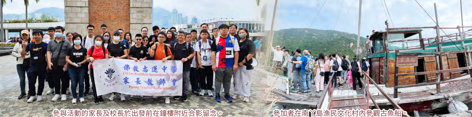
參與活動的家長及校長於出發前在鐘樓附近合影留念。