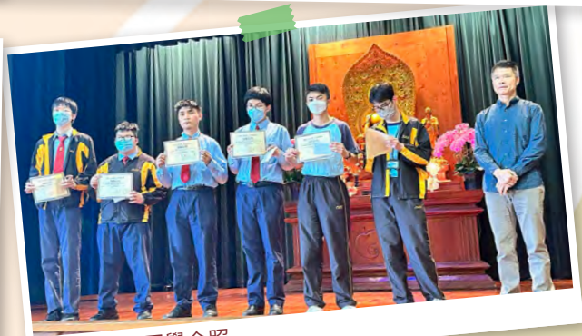
中六級獲獎同學合照