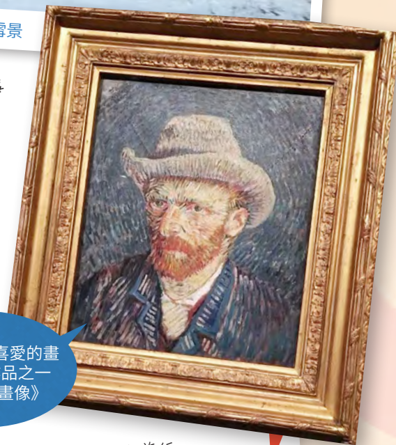
欣賞自己最喜愛的畫家梵谷的作品之一 - 《梵谷自畫像》