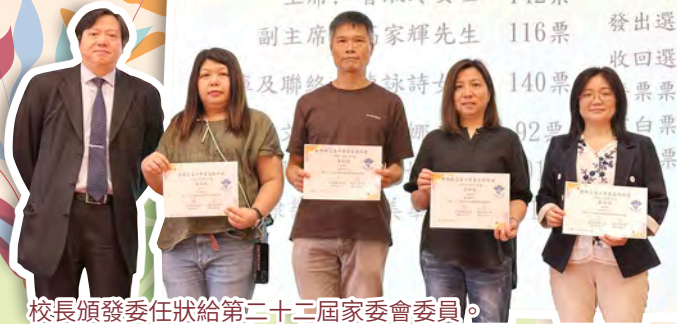
校長頒發委任狀給第二十二屆家委會委員。