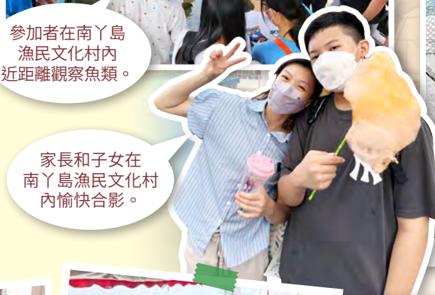
家長和子女在南丫島漁民文化村內愉快合影。