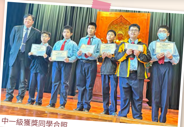
中一級獲獎同學合照