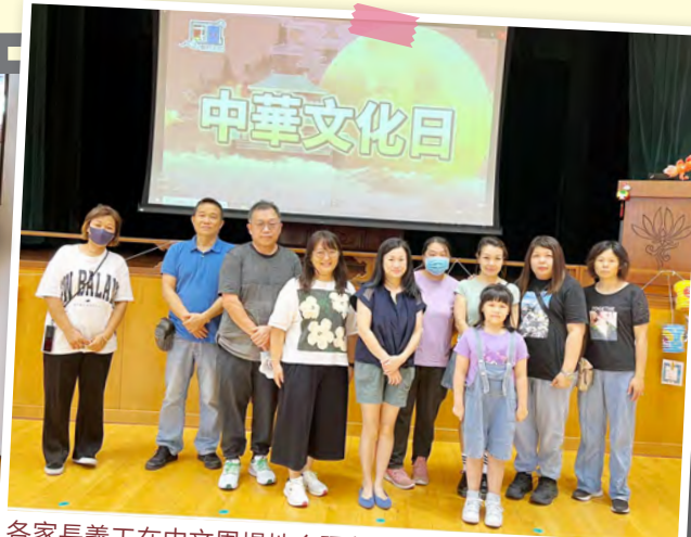
各家長義工在中文周場地合照留念。