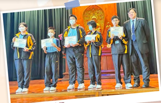
中二級獲獎同學合照