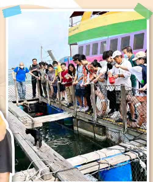
參加者在南丫島漁民文化村內餵食塘中魚。