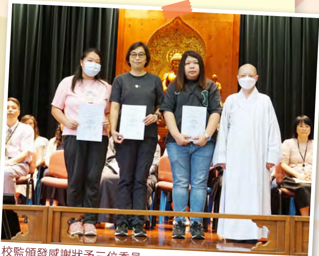
校監頒發感謝狀予三位委員。

校監於9月1日開學典禮頒發感謝狀予第二十一屆家長教師會常務委員，感謝其過去一年的貢獻。