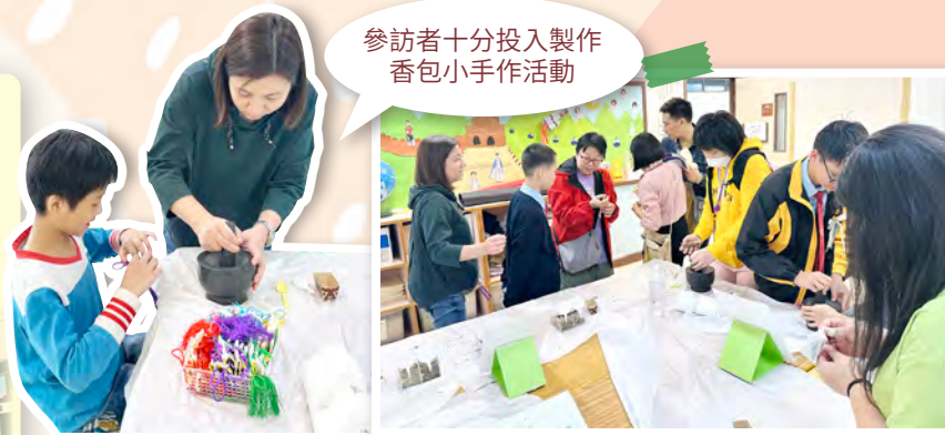
參訪者十分投入製作香包小手作活動