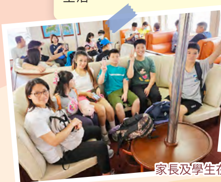
家長及學生在船上愉快地合影。