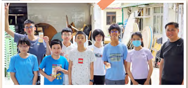
用膳期間的抽獎活動，獲獎者高興地合照。