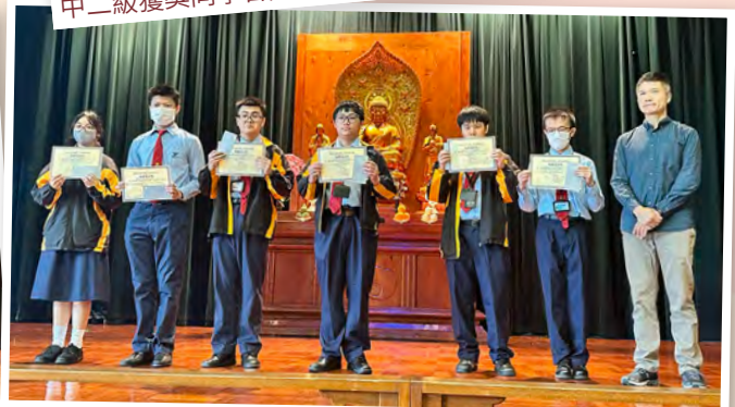
中四級獲獎同學合照