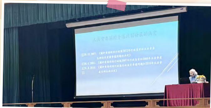
前律政司司長梁愛詩女士主講國家安全教育講座

本校於2023年11月11日於禮堂舉辦了國家安全教育講座，當天有幸邀請到前律政司司長梁愛詩女士到校主講。