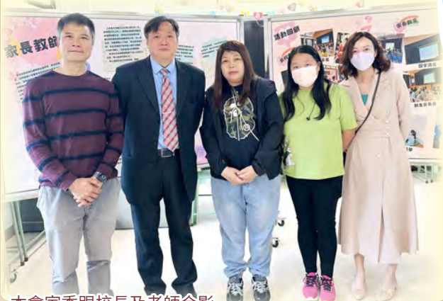
本會家委跟校長及老師合影

本校於2023年12月9日舉辦了全天的開放日。本會的攤位設有歷年活動回顧及家長心聲展板。為了提升親子氛圍，特設簡單小手作攤位供參觀者製作香包，讓他們可作親子手作活動。