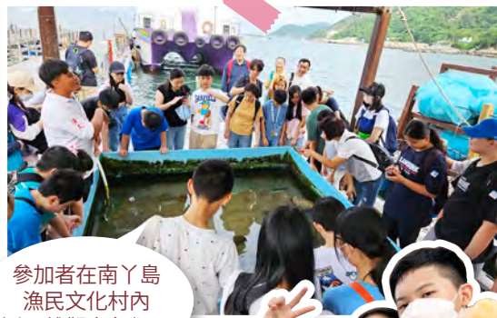
參加者在南丫島漁民文化村內近距離觀察魚類。

因疫情之故，相隔三年而復辦的親子旅行，可謂「萬眾矚目」。活動反應非常熱烈，家長、學生、校長和老師共有142人參加。當天大家於早上11時在尖沙嘴鐘樓集合上船，到達目的地後會先到南丫天虹海鮮酒家享用午餐，之後到南丫島漁民文化村遊覽，體驗漁民生活。