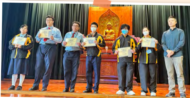
中五級獲獎同學合照