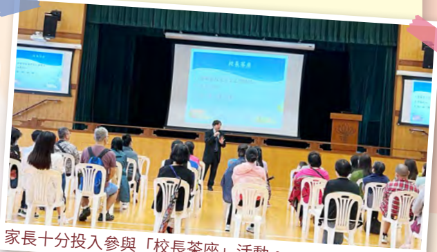
家長十分投入參與「校長茶座」活動。

本會於10月18日舉行會員大會及校長茶座。會員大會完成了會務報告、財務報告及頒發委任狀等工作。大會完結後，便是校長茶座，活動包括參觀學校特別室及與校長交流環節。當天家長投入各環節，對學校有了更多的認識及了解。