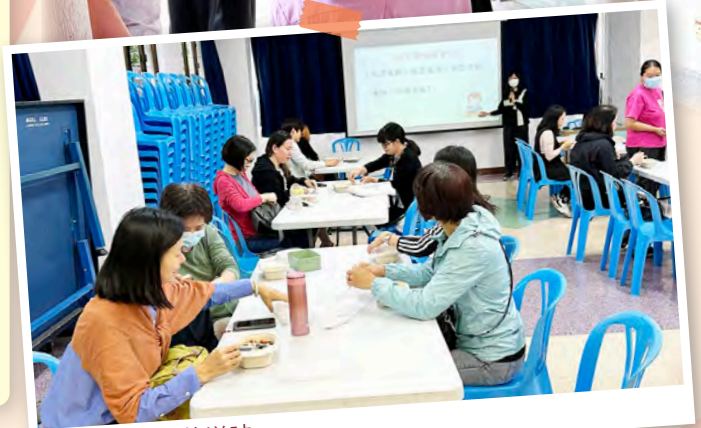
家長到課室觀看學生用膳的情況